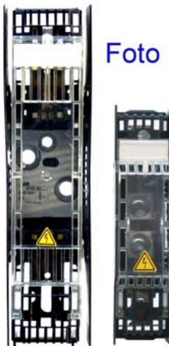
OFAX 1 S1-10 50880030 OFAX 00 S1-10 50880001