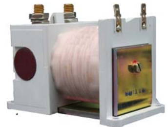
Maßbild Schaltbau